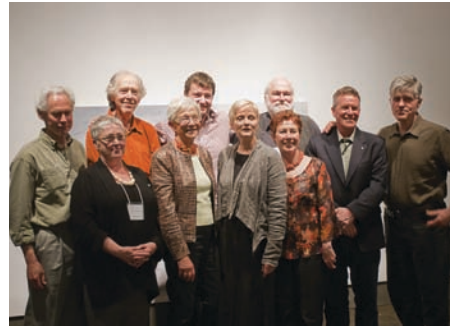
Kitchener / Waterloo membres régionaux à l'Université de Waterloo Art Gallery

d'exprimer leur opinion sur différentes questions concernant notre organisation.