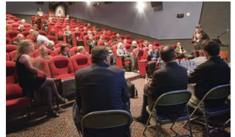
Colloque: Art & Technology, Théâtre Princesse, Waterloo

On pouvait ainsi voir pour la première fois des œuvres du Projet STUDIO de l'Académie, un projet en cours.