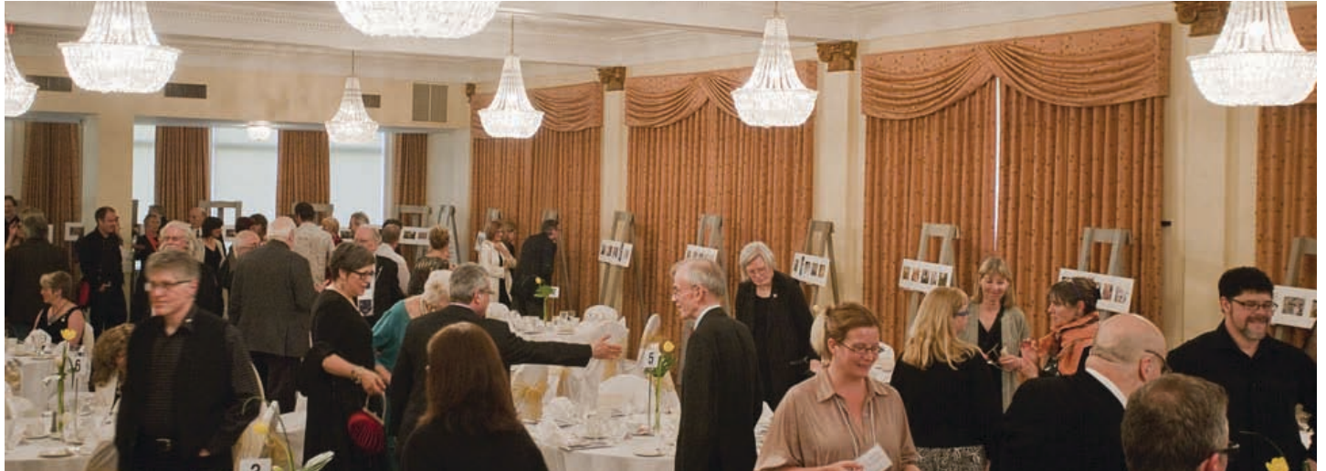
Dîner de la Présidente, Salle de bal Crystal Walper Terrace Hôtel, Waterloo