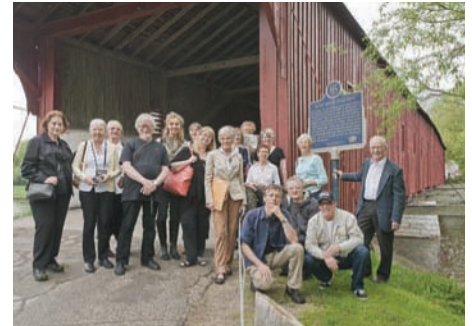
Les membres de l'Académie près d'Elora, en Ontario, au pied du pont couvert derniers restant dans l'Ontario