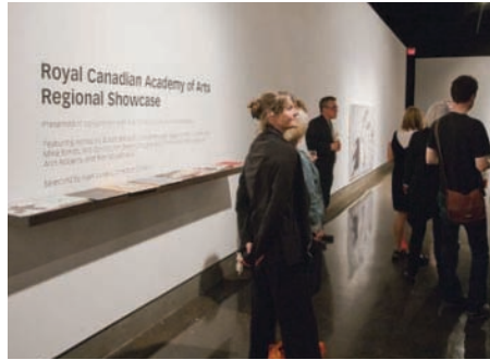
Exposition de Membres régional qui s'est tenu à l'Université de Waterloo Art Gallery

Chaque année, la cérémonie d'intronisation des nouveaux membres est un des moments forts de l'AGA. Lors du Dîner de la Présidente, des diplômes ont été remis à 16 artistes et designers reconnus oeuvrant dans neuf disciplines artistiques.